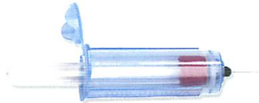
Porta-tubo para muestras sanguíneas VanishPoint®